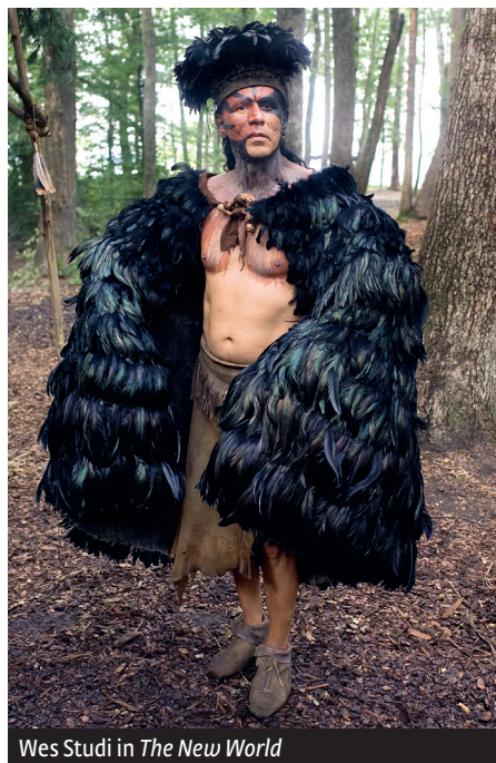
Wes Studi in The New World

Van meet af aan hadden de verhalen uit de Nieuwe Wereld een hoog wauw-gehalte. Toen Hernán Cortés in 1519 in Mexico arriveerde werd hij aangezien voor de God